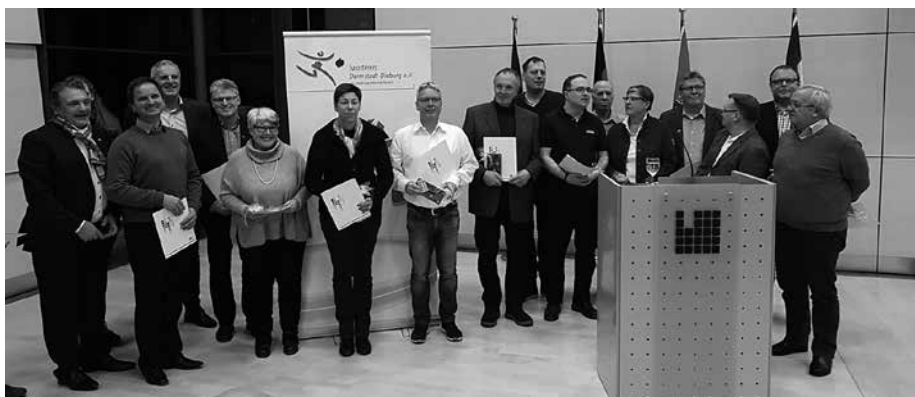
Landrat Hans-Peter Schellhaas bei der Übergabe der Bescheide

Im Rahmen des Neujahrsempfangs des Sportkreises Darmstadt-Dieburg am 22. Januar 2019 im Kreissitzungssaal übergab Landrat Peter Schellhaas die Bescheide an 14 Vereine des Kreises.