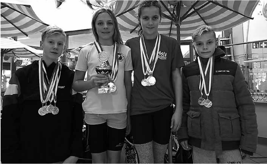
Pokal für die 4 x 50m Lagenstaffel

In diesem Jahr war die SG Weiterstadt nur mit einer ganz kleinen Mannschaft beim 13. Frankfurter Nachwuchs-Po-