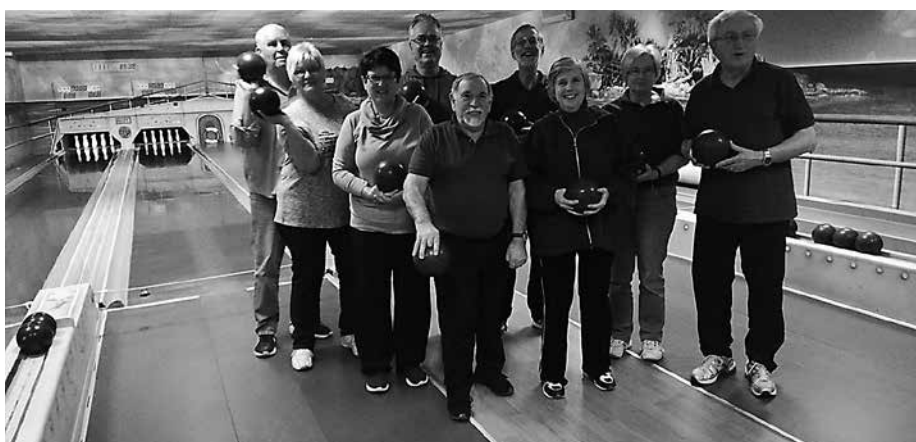
Unsere Truppe bei der Stadtmeisterschaft

Das Jahr neigt sich dem Ende entgegen, aber die Kegler der Senioren 50Plus fiebern ihrem Höhepunkt, nämlich der Stadtmeisterschaft, entgegen. Wie immer haben wir uns an einem Dienstag akribisch, intensiv und professionell vorbereitet und so gut wie möglich die geforderten Einheiten simuliert. Das ist insofern nicht ganz einfach, weil wir die Situation in der zweiten Hälfte der Aktion nicht ausführen können, denn wenn bei uns das Licht aus ist, ist es aus. In Gräfenhausen sind dann wenigstens die Kegel am Ende der Bahn zu erkennen. So gut gerüstet sind wir in Gräfenhausen eingetroffen. Natürlich wird nichts dem Zufall überlassen und so haben wir zunächst die Bahnen ausgelost. Nach fünf Probewürfen wurde es ernst. Zunächst 20 Würfe in die Vollen und 20 Würfe Abräumen. Dann tauschen die Spieler die Bahn, das Licht wechselt und die Spieler stehen im Dunkeln. Wir haben die Option genutzt und einen Spieler ausgetauscht. Das hat lediglich zur Folge, dass die beiden nicht in die Einzelwertung kommen. Nach weiteren je 20 Würfeln stand unser Ergebnis fest. Nachdem die Zahlen eingepflegt waren, hätte das Turnier schon zu Ende sein