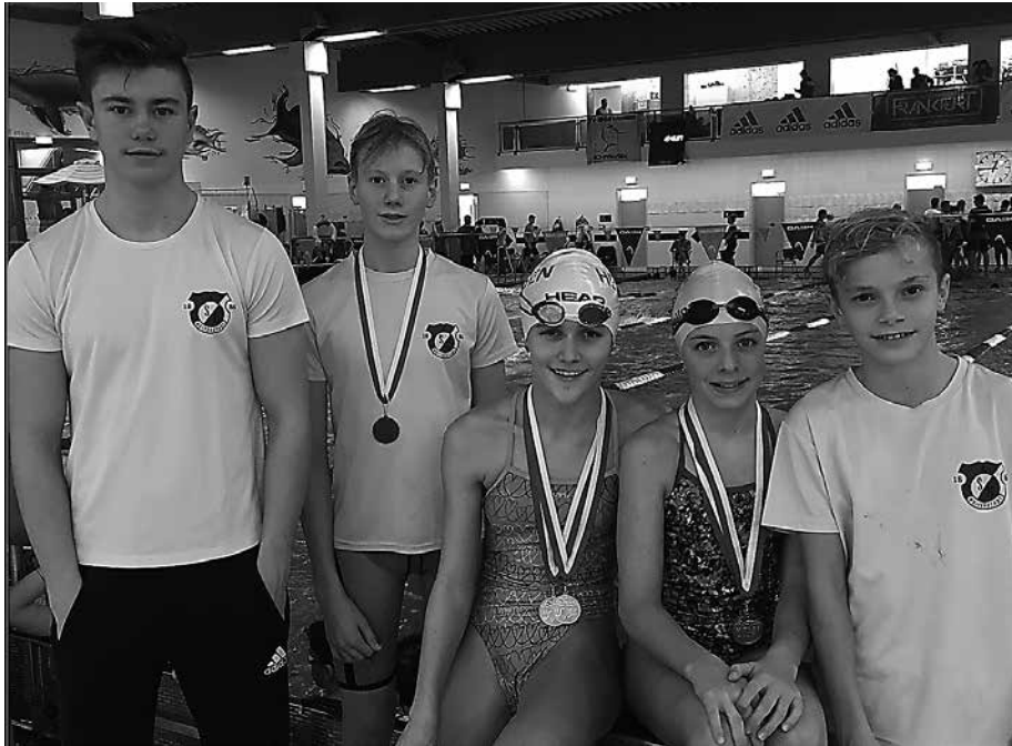
SGW-Team bei Hessischen Jahrgangsmeisterschaften in Höchst

sie dann über die kürzere Distanz 100m Rücken noch eins draufsetzen: In einem spannenden Rennen schlug sie als Erste an und gewann damit den Titel der Hessischen Jahrgangsmeisterin. Mit diesen tollen Resultaten konnte sie auch im Rücken-Mehrkampf die Goldmedaille für sich verbuchen. Platz 4 über 400m Frei-