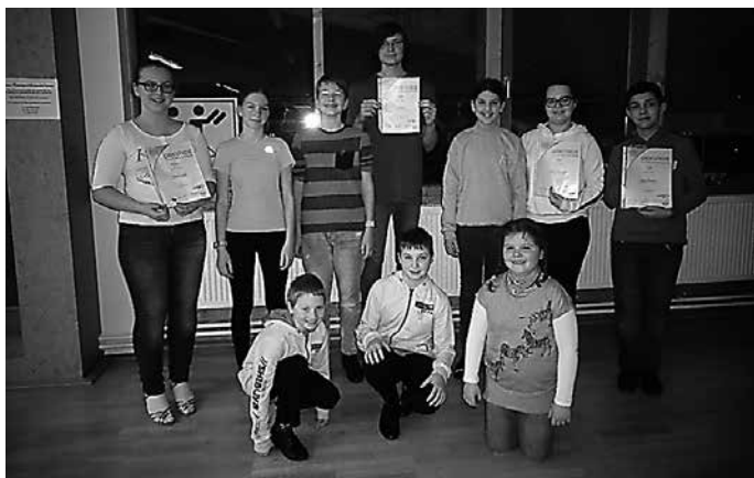
DTSA Jugend und Breitensport; Latein und Standard

denübergabe der erreichten Medaillen der DTSA-Abnahme vom 16. November 2018 und einem anschließenden gemeinsamen Mittagessen startet die TSA in die neue Tanzsaison.